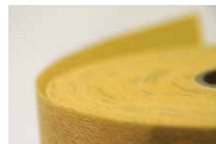
Lámina impermeabilizante DRY 80 de fácil instalación.