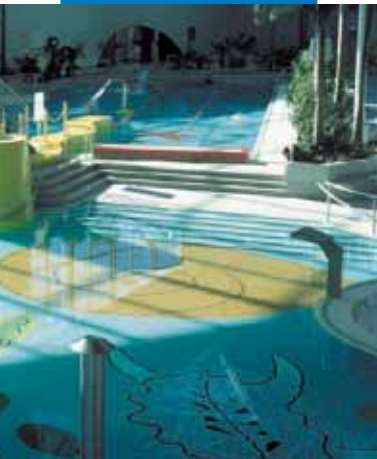
Ejemplo de colocación de mosaico y clinker en piscina

Las referencias relativas a este producto están disponibles bajo petición