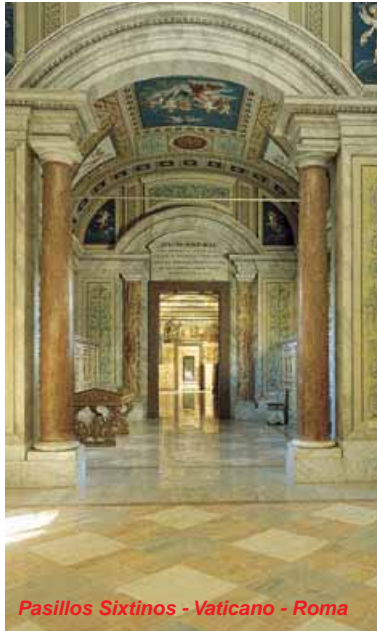
Pasillos Sixtinos - Vaticano - Roma