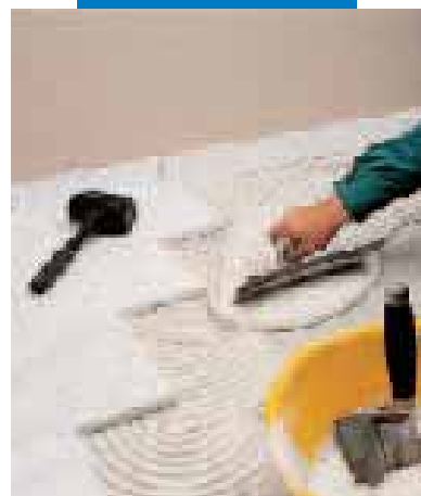
Colocación de mármol blanco de CARRARA con Granirapid blanco