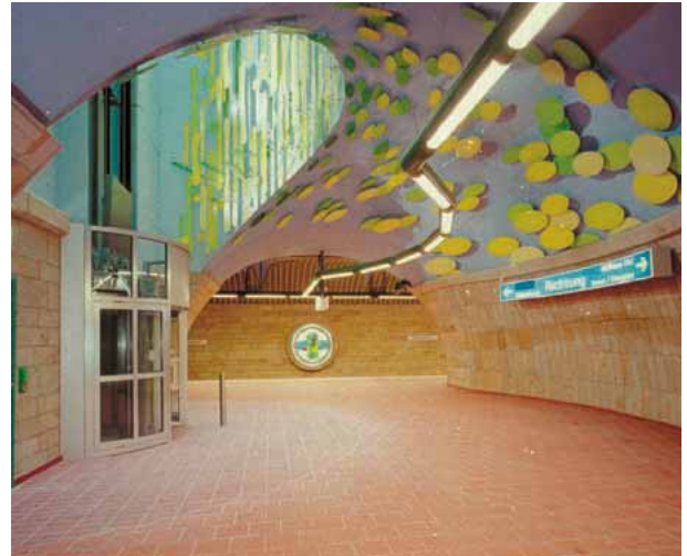
Ejemplo de colocación de granito con Granirapid Metro de Mulheim Ruhr (Alemania)