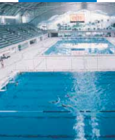
Ejemplo de colocación de mosaico y clinker en piscina - Olympic Centre de Sydney (Australia)