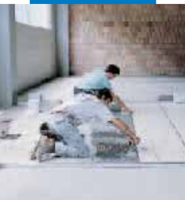
Colocación de gres porcelánico en ambiente industrial