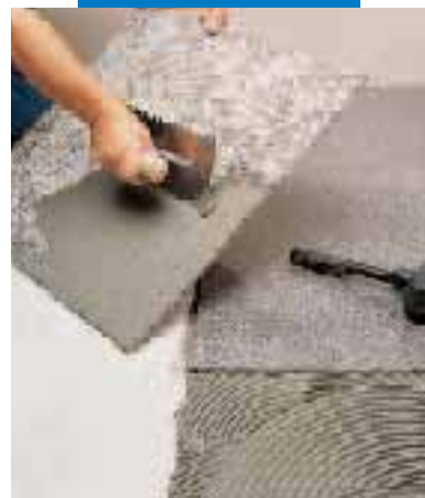
Colocación de granito sintético flexible con Granirapid gris