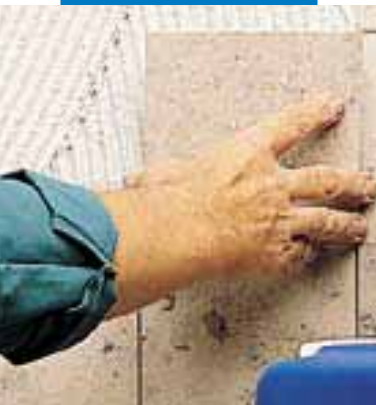
Colocación mármol Jura con Granirapid blanco