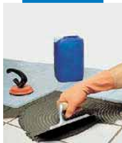
Sobreposición de aglomerado sobre cerámica existente con Granirapid gris