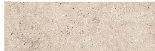
PIEDRAS DEL BRUC BEIGE ANTISLIP 22,5 x 67,5 (G 86) 8,8" x 26,5" m 2