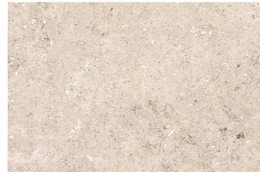
PIEDRAS DEL BRUC BEIGE 45 x 67,5 (G 86) 17,7" x 26,5" m 2 PIEDRAS DEL BRUC BEIGE ANTISLIP 45 x 67,5 (G 86) 17,7" x 26,5" m 2