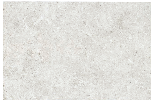
PIEDRAS DEL BRUC BLANCO 45 x 67,5 (G 86) 17,7" x 26,5" m 2 PIEDRAS DEL BRUC BLANCO ANTISLIP 45 x 67,5 (G 86) 17,7" x 26,5" m 2

Comfort floor ▶ R9 - Clase I fine RESISTANCE ▶ R12 - Clase III