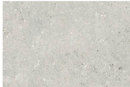
PIEDRAS DEL BRUC GRIS 45 x 67,5 (G 86) 17,7" x 26,5" m 2 PIEDRAS DEL BRUC GRIS ANTISLIP 45 x 67,5 (G 86) 17,7" x 26,5" m 2