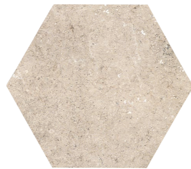
PIEDRAS DEL BRUC BEIGE HEX. ANTISLIP 45 x 52 (G 77) 17,7" x 20,3" m 2

fine RESISTANCE ▶ R12 - Clase III Comfort floor ▶ R9 - Clase I