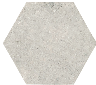
PIEDRAS DEL BRUC GRIS HEX. ANTISLIP 45 x 52 (G 77) 17,7" x 20,3" m 2