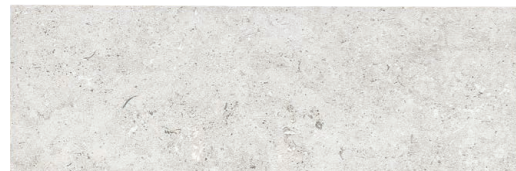
PIEDRAS DEL BRUC BLANCO ANTISLIP 22,5 x 67,5 (G 86) 8,8" x 26,5" m 2