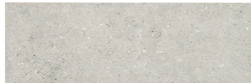
PIEDRAS DEL BRUC GRIS ANTISLIP 22,5 x 67,5 (G 86) 8,8" x 26,5" m 2