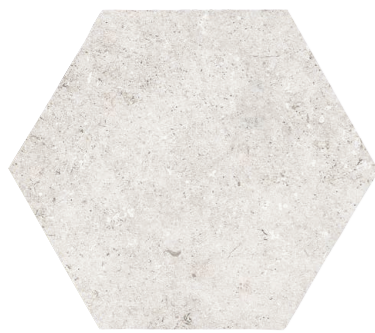
PIEDRAS DEL BRUC BLANCO HEX. ANTISLIP 45 x 52 (G 77) 17,7" x 20,3" m 2